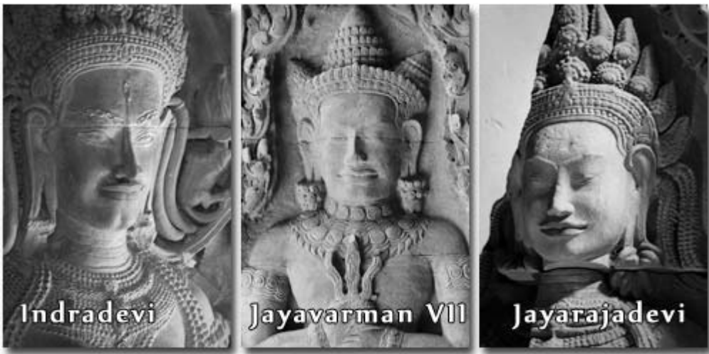
ព្រះមហាក្សត្រឥន្ទ្រទេវី ព្រះបាទជ័យវរ្ម័នទី៧ និងព្រះមហាក្សត្រិជ័យរាជទេវី

ពេលវេលាសម្រាប់ក្មេងជំនាន់ក្រោយក្នុងការយល់ដឹងពីព្រះបាទជ័យវរ្ម័នទី៧ និងព្រះអគ្គមហេសីទាំងពីររបស់ព្រះអង្គតាមរយៈចំណារដ៏ច្បាស់នេះបានមកដល់ហើយ។ បូជនីយស្ថាន ផ្ទាំងសិលាចារឹក និងចម្លាក់លៀនបានបង្ហាញយើងទាំងអស់គ្នាអោយឃើញពីអ្នកដឹកនាំ ដ៏សប្បុរសដែលយកចិត្តទុកដាក់ពីប្រជាពលរដ្ឋរបស់ខ្លួន។ ព្រះមហាក្សត្រ និងម្ចាស់ក្សត្រិទាំងពីរធ្វើការជាមួយគ្នាដើម្បីទទួលបាននូវអ្វីដែលមនុស្សគ្រប់រូបធ្លាប់បានគិតថា វាមិនអាចធ្វើបាននៅក្នុងការកសាងព្រះរាជនគរដ៏រុងរឿងមួយដែលពោរពេញដោយការបង្កើតថ្មីទាំងផ្នែកហេដ្ឋា-