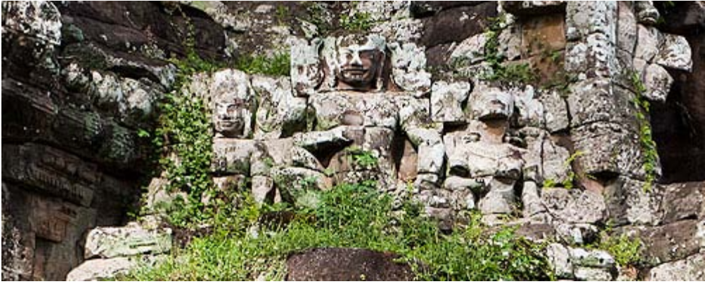
នៅខ្លោងទ្វារទាំងប្រាំនៃប្រាសាទអង្គរធំ ក្បួនទាំងបីអង្គសម្តែងការស្វាគមន៍ភ្ញៀវទេសចរណ៍