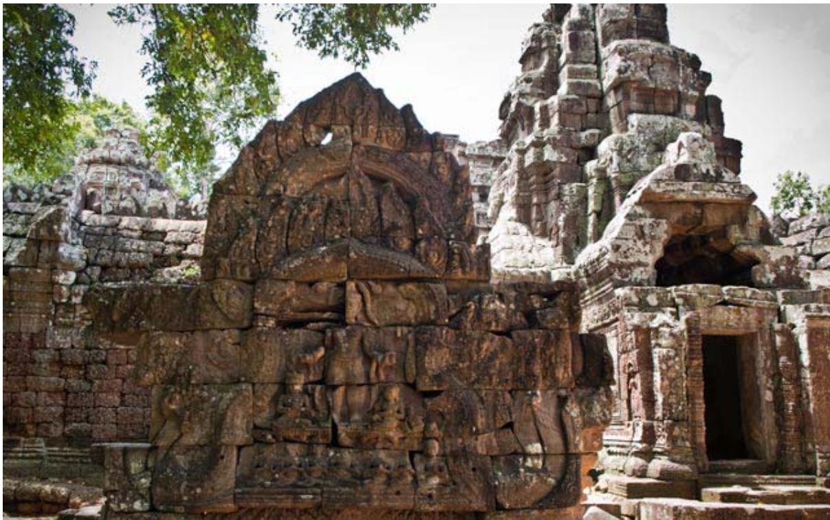
អ្នកអភិរក្សជាតិចារាំងបានសាងសង់កំពូលបូជនីយស្ថានដែលបែកចាក់នៅខ្លោងទ្វារប្រាសាទតាសោមឡើងវិញ។ នៅខាងឆ្វេងដៃ ព្រះមហាក្សត្របានគោរពបូជាព្រះពោធិ៍សត្វលោកេស្វរៈ

ជាពិសេសនៅទីសក្តារបូជានៅក្នុងព្រះវិហារដែលបច្ចុប្បន្ននេះត្រូវបានស្គាល់ថាជាប្រាសាទតាព្រហ្ម ព្រះ ទាំងបីអង្គរបស់ព្រះពុទ្ធមហាយានត្រូវបានធ្លាក់នៅលើផ្ទាំងសិលាកំពស់ពីរម៉ែត្រ។ ប៉ុន្តែបឋមរបស់ព្រះពុទ្ធមហា- យានរាប់ពាន់ឆ្នាំត្រូវបានបំផ្លិចបំផ្លាញដោយអ្នកគោរពព្រហ្មមញ្ញសាសនាក្រោយរជ្ជកាលព្រះបាទជ័យវរ្ម័នទី៧ (សូមមើលរូបភាពខាងលើ) ។ នៅប្រាសាទតាសោមអ្នកកាន់ព្រហ្មមញ្ញសាសនាបានបំផ្លាញកំពូលបូជនីយស្ថាន ដែលមានធ្នាក់រូបព្រះពោធិ៍សត្វលោកេស្វរៈនៅតាមខ្លោងប្រាសាទធំៗ ដោយបំបាត់រូបខាងមុខទាំងស្រុងចោល។ នៅតាមកំពូលបូជនីយស្ថានដែលព្រះមហាក្សត្រ និងព្រះមហាក្សត្រីគោរពបូជាព្រះបញ្ញាបរាមិតារូបចម្លាក់របស់ ព្រះបញ្ញាបរាមិតា និងព្រះរាជាផ្សេងទៀតត្រូវបានដាច់ ហើយបន្ទាប់មកទៀតត្រូវបានបំផ្លាញទាំងស្រុងតែម្តង (សូមមើលរូបខាងក្រោម) ។