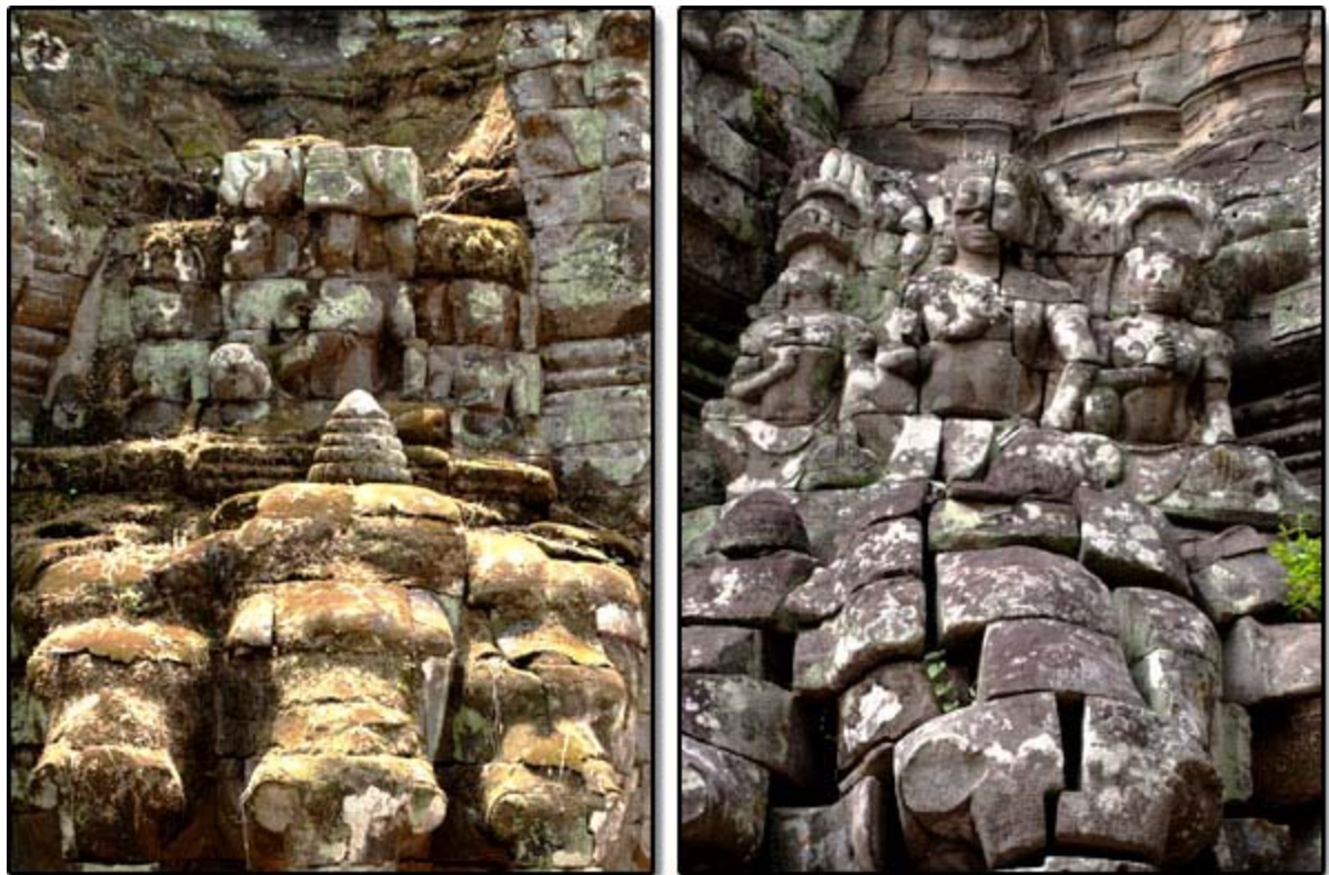
ជីវដែលមានពាក់ម្តុកកំពូលបិបិតនៅខាងក្រោមរូបក្សត្រទាំងបីអង្គដែលចាត់រូបរាង។ ចូរកត់សំគាល់ការគង់លើទីតាំងដែលបង្ហាញអំណាចស្មើរបស់ម្ចាស់ក្សត្រីទាំងពីរ និងព្រះមហាក្សត្រ។

ធ្វើការស្វាគមន៍ដល់ភ្ញៀវទេសចរណ៍គ្រប់ៗគ្នា ( សូមមើលរូបខាងក្រោម ) ។ ចូរកត់សំគាល់ថារូបក្សត្រទាំងបីព្រះអង្គគង់លើទីតាំងដែលបង្ហាញអំណាចស្មើគ្នាដោយលើកជង្គង់មួយឡើងលើដាក់កែងដៃស្តាំលើជង្គង់ ហើយនិងដៃស្តាំកាន់អាវុធ ឬវត្ថុ ( អាវុធដែលមានអានុភាពរបស់ព្រះឥន្ទ ឬព្រះក្នុងសាសនាហិណ្ឌូ ) នៅលើដើមទ្រូង។ ព្រះបាទជ័យវរ្ម័នទី៧បានបង្ហាញអោយសាធារណៈជនអំពីឥទ្ធិពលរបស់ម្ចាស់ក្សត្រិតន្ត្រទេវី និងម្ចាស់ក្សត្រីជ័យរាជទេវីដែលមានអំណាចទៅលើការគ្រប់គ្រង និងរៀបចំនីតិវដ្ត។